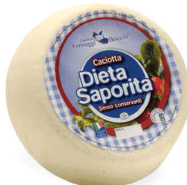
CACIOTTA DIETA SAPORITA

● ..... Codice Articolo A08 A30 intero 400g x 8 Peso 1,2kg 3,2kg