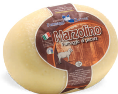
MARZOLINO DI PURA PECORA

Codice Articolo A15 A27 intero 400g x 8 Peso 1,8kg 3,2kg