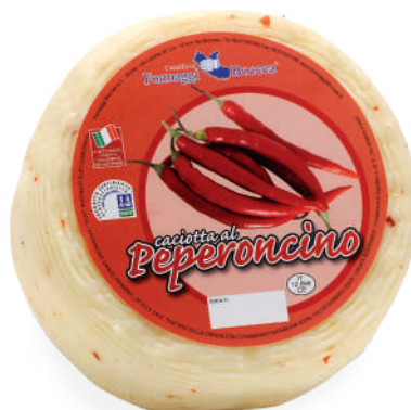
CACIOTTA AL PEPERONCINO