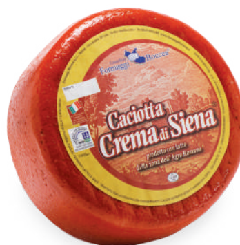
CACIOTTA CREMA DI SIENA

Codice Articolo A13 A25 intero 400g x 8 Peso 1,8kg 3,2kg