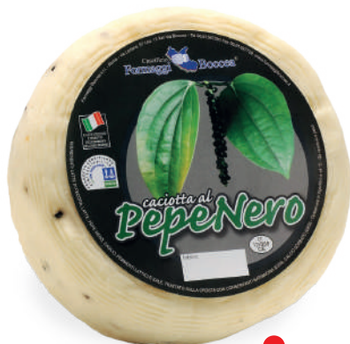
CACIOTTA AL PEPE NERO