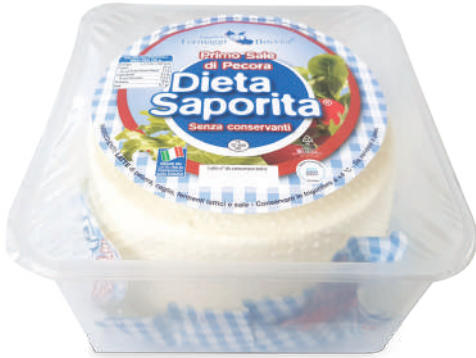
PRIMO SALE DI PECORA DIETA SAPORITA 1,4kg x 2