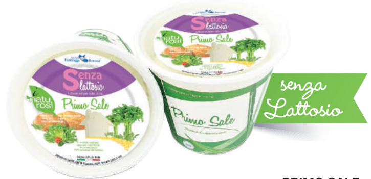
PRIMO SALE SENZA LATTOSIO 300g x 7