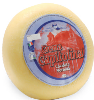
CACIOTTA CREMA CAPITOLINA

Codice Articolo A13 A25 intero 400g x 8 Peso 1,8kg 3,2kg