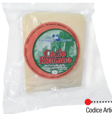
CACIO ROMANO 400g x 16